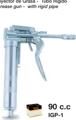
Inyector de Grasa Tipo Pistola - Tubo Rígido Grease Gun Pistol Type