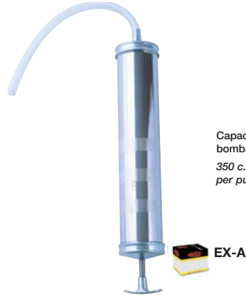
Extractor de Aceite - Manguera Flexible de 30.5 cm. HD Oil Suction with - 30.5 cm Flexible hose.