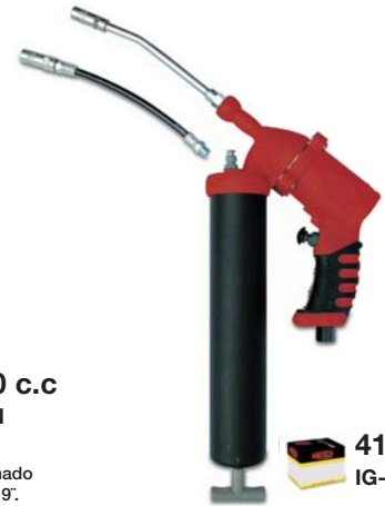
Inyector de Grasa Neumatico de Lujo Tubo rígido y manguera flexible de 9'. Pneumatic Deluxe Grease Gun Rigid spout and flexible 9" hose.