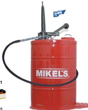
Cubeta con Bomba Manual para Aceite 19 litros (Gallinita) *Despacha 1/4 de litro por carrera del émbolo. *Manguera plastica de 1/2" x 1.70 m de largo. *Dimensiones de la cubeta: 42 x 80 cm.

Manual Bucket for Oil 19 liters *Delivers 1/4" of liter per cycle. *1/2" x 1.70 m plastic hose. *Bucket dimensions: 42 x 80 cm.