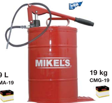
Cubeta con Bomba Manual para Grasa 19 kg (Gallinita) *Despacha 300 g. de grasa por carrera del émbolo. *Presión máxima de trabajo: 5000 PSI. *Manguera de alta presión de 1.5 m. de largo con extension de acero y boquilla hidráulica. *Dimensiones de la cubeta: 42 x 80 cm.

Manual Bucket for Grease 19 kg *Delivers 300 g. of grease per cycle. *Max. working pressure: 5000 PSI. *High pressure hose, 1.5 m. long with steel extension and hydraulic nozzle. *Bucket dimensions: 42 x 80 cm.