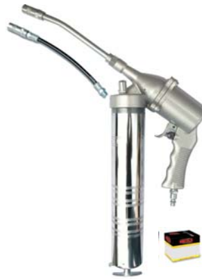
Inyector de Grasa Neumatico Cromado Tubo rígido y manguera flexible de 9'. Pneumatic Chromed Grease Gun Rigid spout and flexible 9" hose.