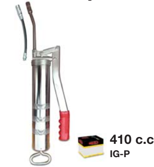
Inyector de Grasa Cromado Tipo Palanca Tubo rígido y manguera flexible de 9'. Chromed grease gun Rigid spout and flexible 9" hose.