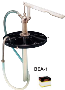
Bomba Extractora para Aceite Manguera de 1.20 m. Oil Bucket Pump 1.20 m hose.