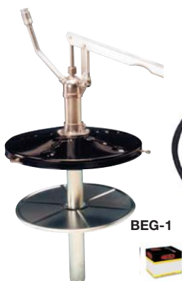
Bomba Extractora para Grasa Grease Bucket Pump