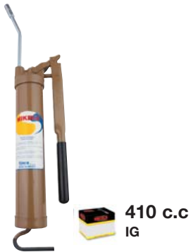
Inyector de Grasa - Tubo Rígido Grease gun - with rigid pipe