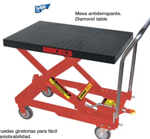
Mesa antiderrapante. Diamond table.